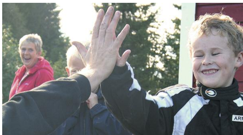
KNA Oppland – med mange nye 6/7 åringer.