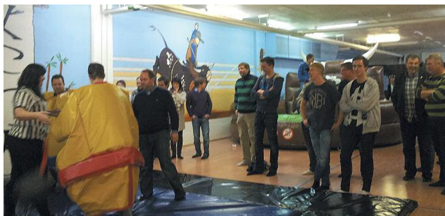
KNA Vålerbanen – Hyggelig og morsomt samvær i klubben.

For 2013 er det på nytt appobert KNA Challenge Sør, og avdelingen har sammen med KNA Sokndal Motorsport og KNA Stavanger planlagt å lage en «nybegynnercup» i challenge. Denne vil bestå i at avdelingene lager hvert sitt nybegynnerløp og at KNA Challenge Sør skal telle med, nærmest som finale. De lokale løpene blir kombinert med kurs, og alle tre avdel-