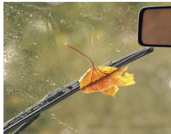
Rabatt på skifte og reparasjon av bilglass.