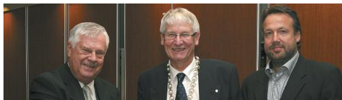
KNA Oppland – Årets avdeling 2011

HS har gode erfaringer med denne form for møter og flere slike vil bli avholdt rundt i landet frem mot neste Landsmøte.