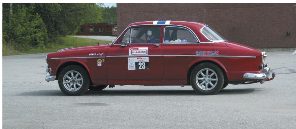
KNA Halden – fra Fredriksten Challenge.