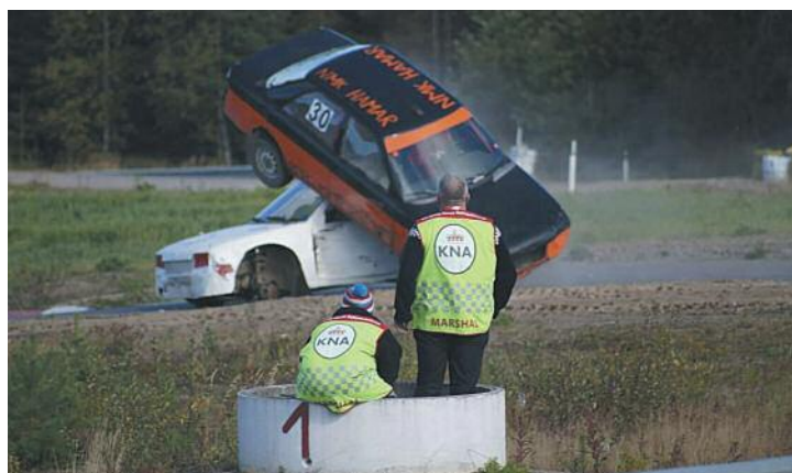
KNA Solør Motorsport – KNAs funksjonærer er alltid til stede der det skjer.