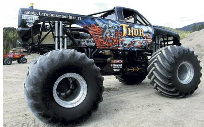
KNA Telemark – Store dimensjoner i Monster Race.