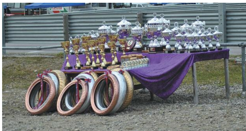
KNA Solør Motorsport – Flotte premier til vinnerne.

I 2012 var det 15. Rally Monte Carlo Historique . Oslo var én av flere startsteder. Starten gikk utenfor Scandic Hotell KNA som