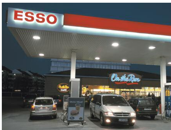
Rabatt på drivstoff ved bruk av Esso MasterCard.