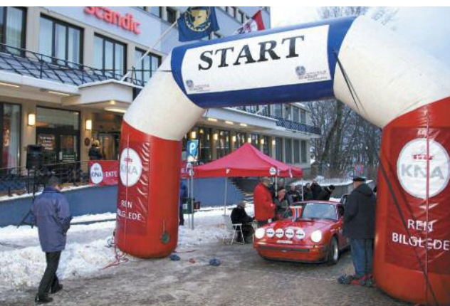
Fra starten Rallye Monte-Carlo Historique 2012.