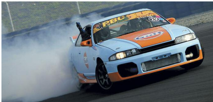
KNA Vålerbanen - drifting, en bilsportgren i vekst.

Lørdag 18. august ble Rally Sokndal arrangert. Arrangementet gjøres mulig gjennom ca. 120 funksjonærer som gjør en fantastisk jobb i alle typer oppgaver. Ca. 30 biler stilte til start og de fikk kjøre på svingete og røffe veier. SS'en varierer fra 2 km til ca. 15 km, totalt rett under 100 km fart og ca. 150 km transport. Dette året fikk også dugnadsgjengen gratis inngang på kveldsarrangementet etter Rallyet, hvor «Vestlands-