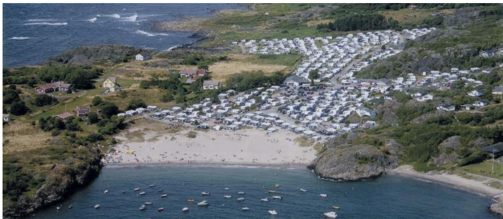
Oddane Sand Camping med den flotte og populære sandstranden.