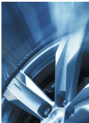
Rabatt på dekk og felger.