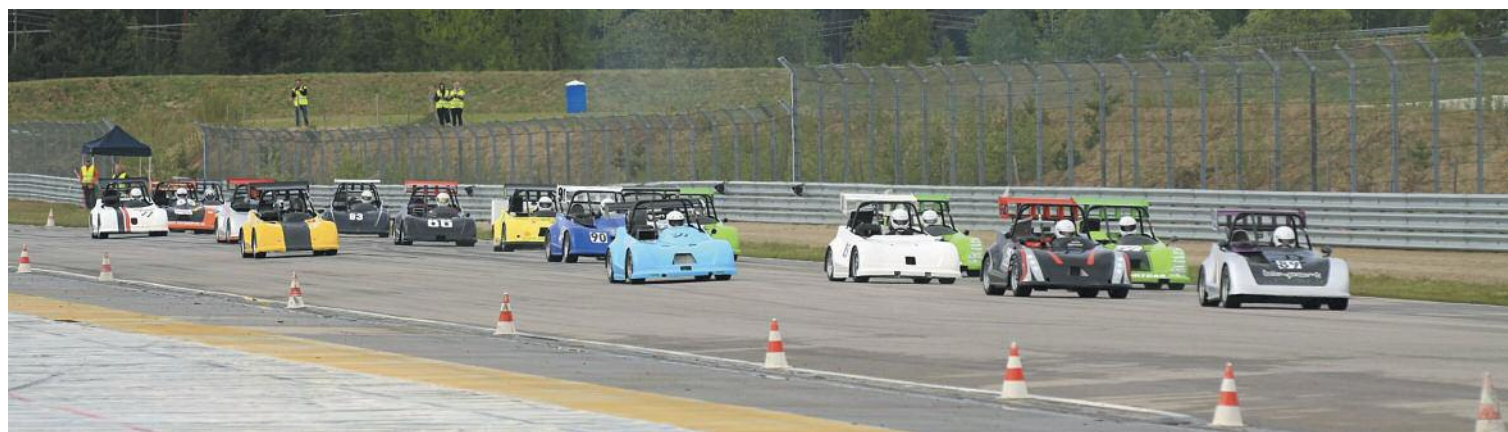
KNA Vålerbanen – Short car – eneste kjøretøy du kan benytte i Rallycross, Racing og bakkeløp (400 kg - 200 hk.).