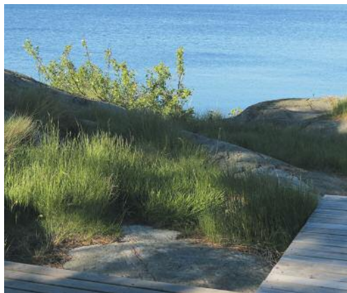
Sommerstemning ved Homborsund.

Mølen er et yndet utfartssted hele året, med gamle gravplasser fra Vikingtiden og et stort og flott område med rullestein. Området er fredet. Stavern med Fredriksvern festning er verdt flere besøk, enten man ønsker å spise ute eller se den vakre originale bebyggelsen på gamle Fredriksvern Verft. Helgeroa har en koselig marina med flott gjestehavn.