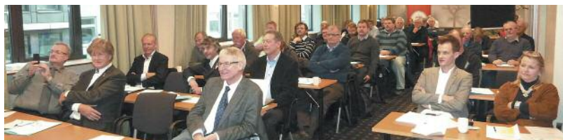
Avdelingsmøte på KNA Hotellet 1. desember 2012.