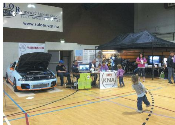
KNA Vålerbanen – Fra Aktivitetsmessen på Årnes.