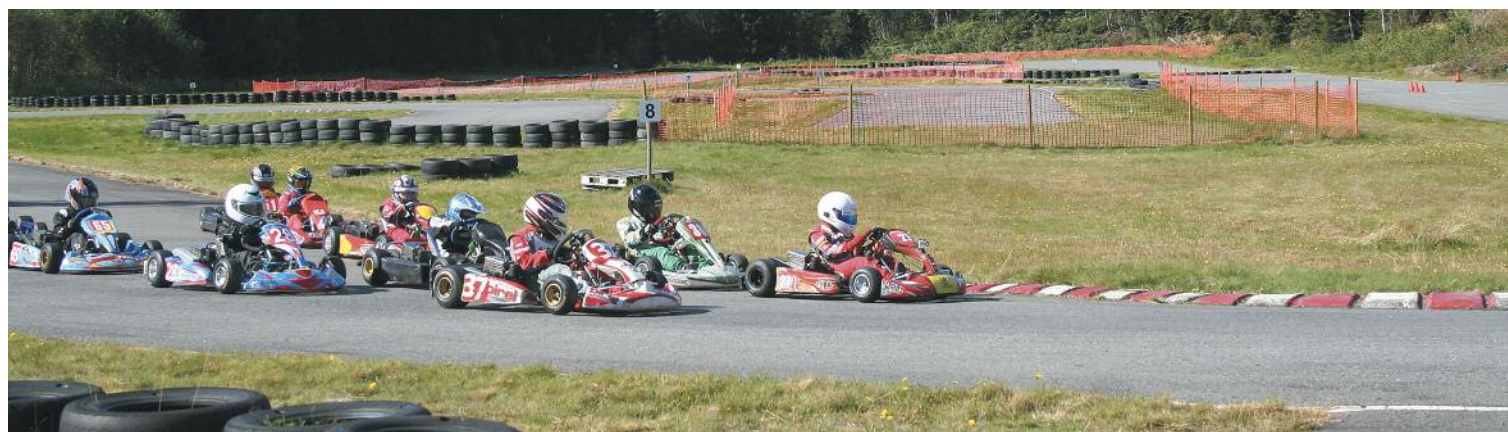
KNA Oppland – Gokartløp i Elvedalen.

I 2012 kom vi tilbake til mer normal drift etter mange år med meget stor aktivitet med oppgradering av hyttene. Våren 2012 startet vi med utskifting av en del råtnede panelbord i fronten på Lillehammerhyttene, før fasaden mot stranda og rekkverk på veranda og trapp ble malt. Noe sengetøy og litt utemøbler var det nødvendig å skifte ut med nytt. Sofagrupper i Lillehammer 1 ble også erstattet med ei «ny» fra det lokale brukmarkedet. Etter utbedring av noen mindre frostskafer i Oppland 2, kunne vi se lyst på sommersesongen, men det viste seg at vi fikk ubudte gjester i form av mus i både Oppland 1 og Lillehammer 1. Disse kom inn langs vann og avløpsrørene under benken i begge hyttene. En klarte å stoppe det med bruk av gift og midlertidig tetting med stålull, mens permanent tetting av adkomstveier ble utført etter sesongen.