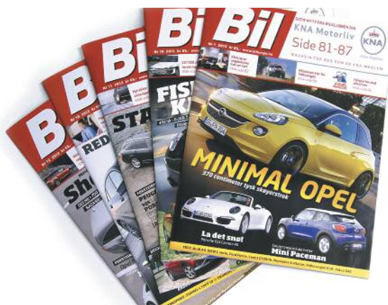
10 utgaver av bladet BIL i året, inkludert 7 sider medlemsstoff.

Ved å legge inn bilens registreringsnummer og e-postadressen vil det bli sendt en påminnelse om fristen for neste EU-kontroll av bilen.