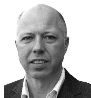
Ole-Øyvind Rønningen Daglig leder (fra mai 2013) Drift av Oddane Sand Camping