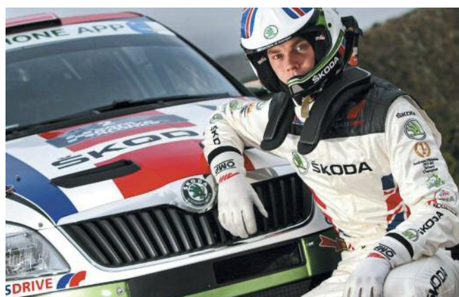
KNA Kongsvinger – Andreas Mikkelsen, årets bilspurtøver 2012.