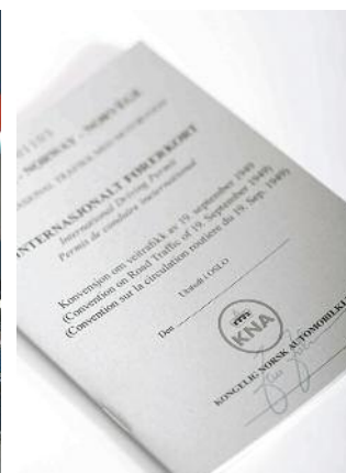
Internasjonalt førerkort til gunstig pris.