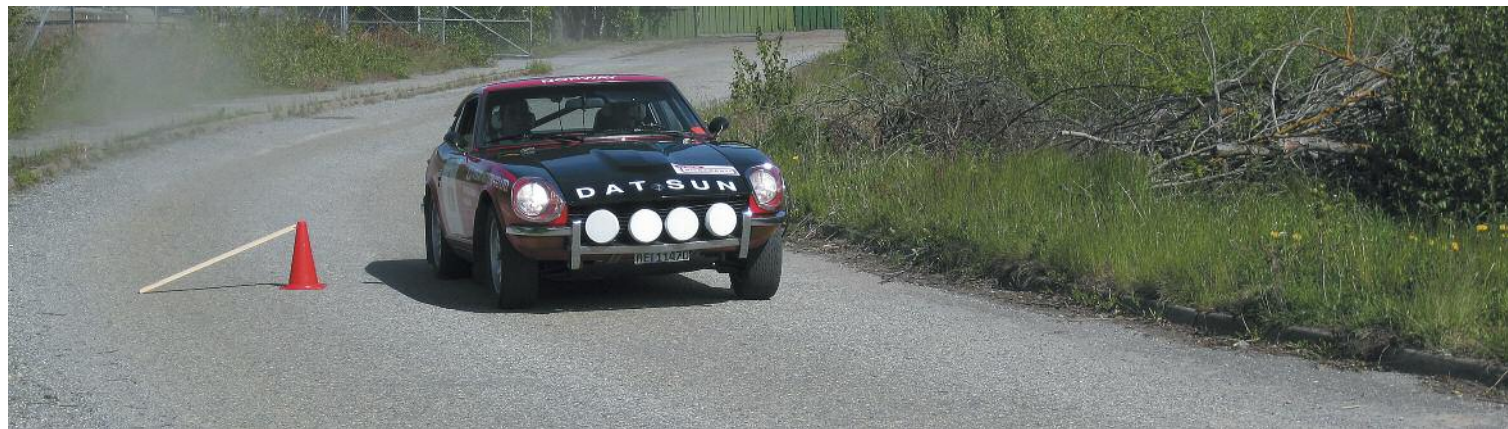
KNA Halden - Fredriksten Challenge.

Avdelingens hytte på Homborsund har vært utleid i åtte uker i 2012. Noen av klubbens medlemmer var med på fellesdugnad/«gravøl» på Homborsund høsten 2012. Da «byttet» vi hytte, siden området på Homborsund er planlagt solgt. Nå dis-